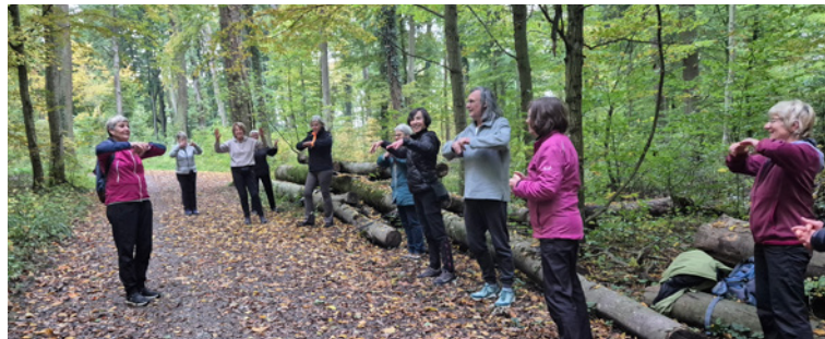
Sanft bewegt an der frischen Luft beim Gesundheitswandern im Oktober 2025