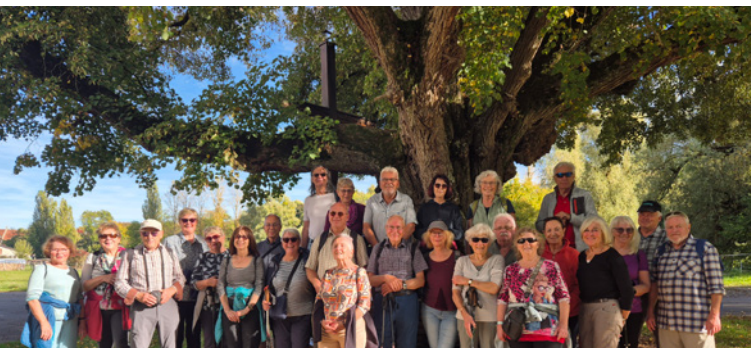
60 plus: Oktober-Wanderung 2025 um Poltringen