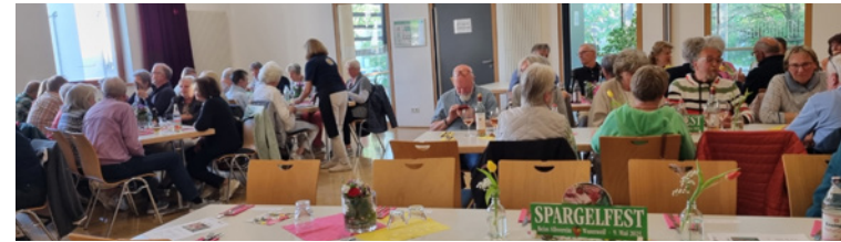
Geselliges Spargelessen 2025

Ein Besuch im Scheunen kino im Jan./Febr. 2026, Mutscheln, unser Spargelfest, eine Führung im SAV-Museum im Dorf Betzingen im Mai, Reiseberichte, eine Stadtführung, der im Sommer geplante Besuch im Naturtheater und das White Dinner, Maultaschen-essen, und unser Stammtisch „Albvereinsfreunde treffen sich“ bieten uns Kultur und gute Unterhaltung.