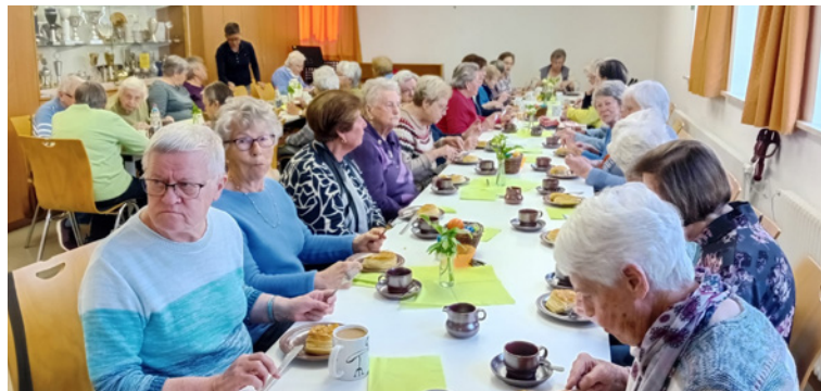
Schiedwecken-Essen beim Frauentreff 2025