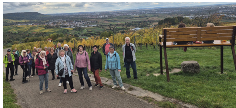
Im Weingebiet mit Nuss-Skulpturenweg bei Strümpfelbach im Oktober 2025