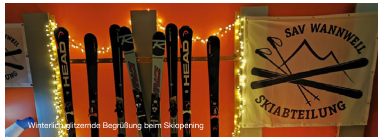
Winterlich glitzernde Begrüßung beim Skipopening

Näheres zu obigen Veranstaltungen finden Sie im separaten Veranstaltungsplan der Skiabteilung oder auf der Homepage: www.sav-wannweil.de/skiabteilung