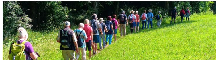
Wanderfreunde in ihrem Element

Telefon: 0711/225850 Zentrale Telefax: 0711/2258592 Internet: www.schwaebischer-albverein.de E-Mail: info@schwaebischer-albverein.de