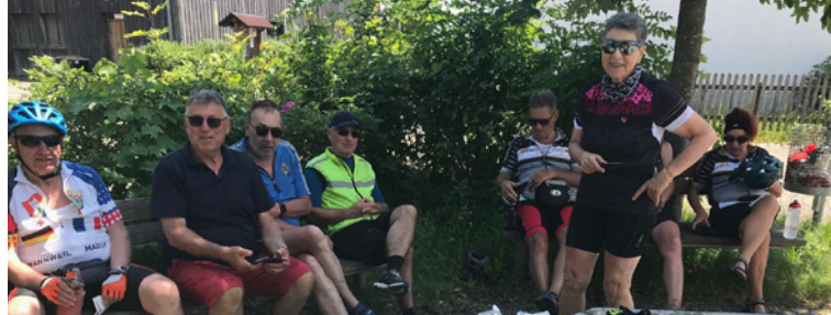
Eine Pause bei der sportlichen Radtour um Bad Wimpfen

So handhaben es auch unsere Albvereinsfrauen seit 46 Jahren, jedoch derzeit mit der Besonderheit, dass sie handgearbeitete Erzeugnisse auf dem Weihnachts- und Ostermarkt anbieten und den Erlös einem guten Zweck zukommen lassen. So konnten sie 2025 das DRK, Helfer vor Ort, mit 1.000 € unterstützen. Freundliche Bewirtung mit Kaffee & Co darf bei den Treffen nicht fehlen. In der wärmeren Jahreszeit gibt es von Zeit zu Zeit einen Busausflug und ein monatliches Eisessen.