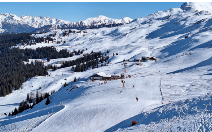
Ski-Wochenende in Sterzing