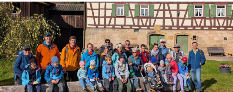
Familienwochenende in Murrhardt im Oktober 2025, Heinlesmühle