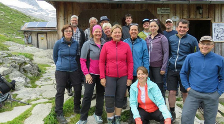
Bergfrühling in der Region Zillertal 2025: die Hüttengruppe